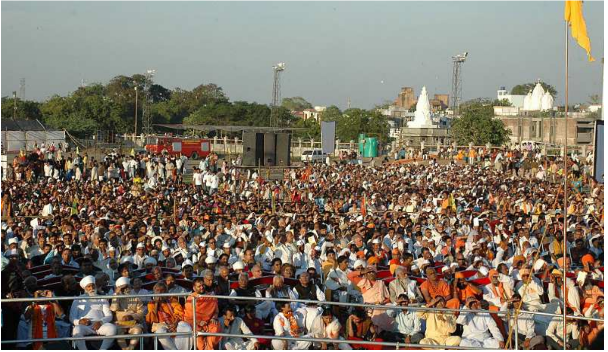
ಜನವರಿ 17, 2010ರಂದು ನಾಗಪುರದಲ್ಲಿ ಜರುಗಿದ ವಿಶ್ವ ಮಂಗಲ ಗೋ ಗ್ರಾಮ ಯಾತ್ರೆಯ ಭವ್ಯ ಸಮಾರೋಹ ಸಭೆ